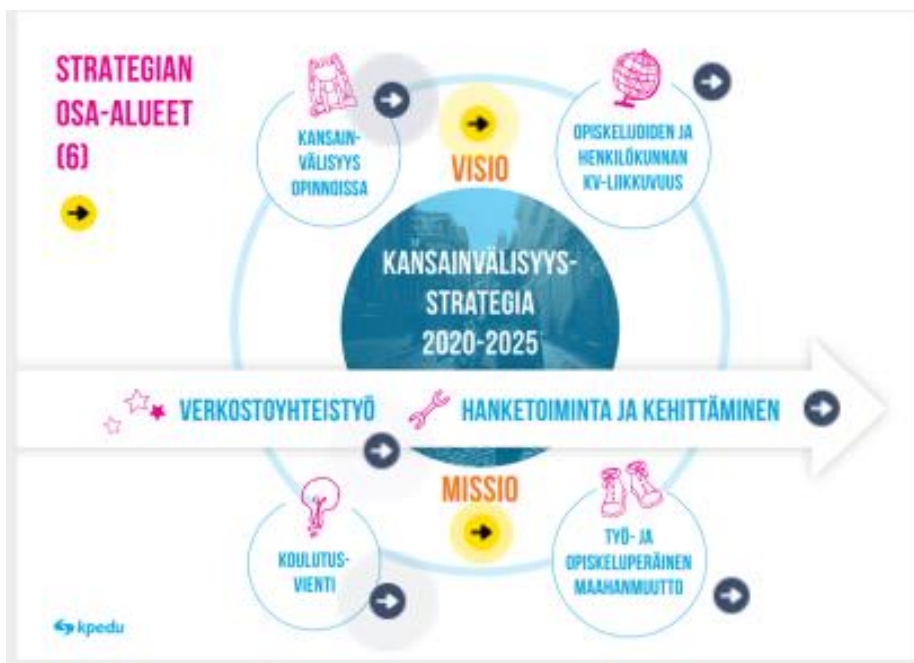
Kuva 5. Kansainvälisyysstrategian pääsivu

https://www.thinglink.com/scene/1378264777821782018