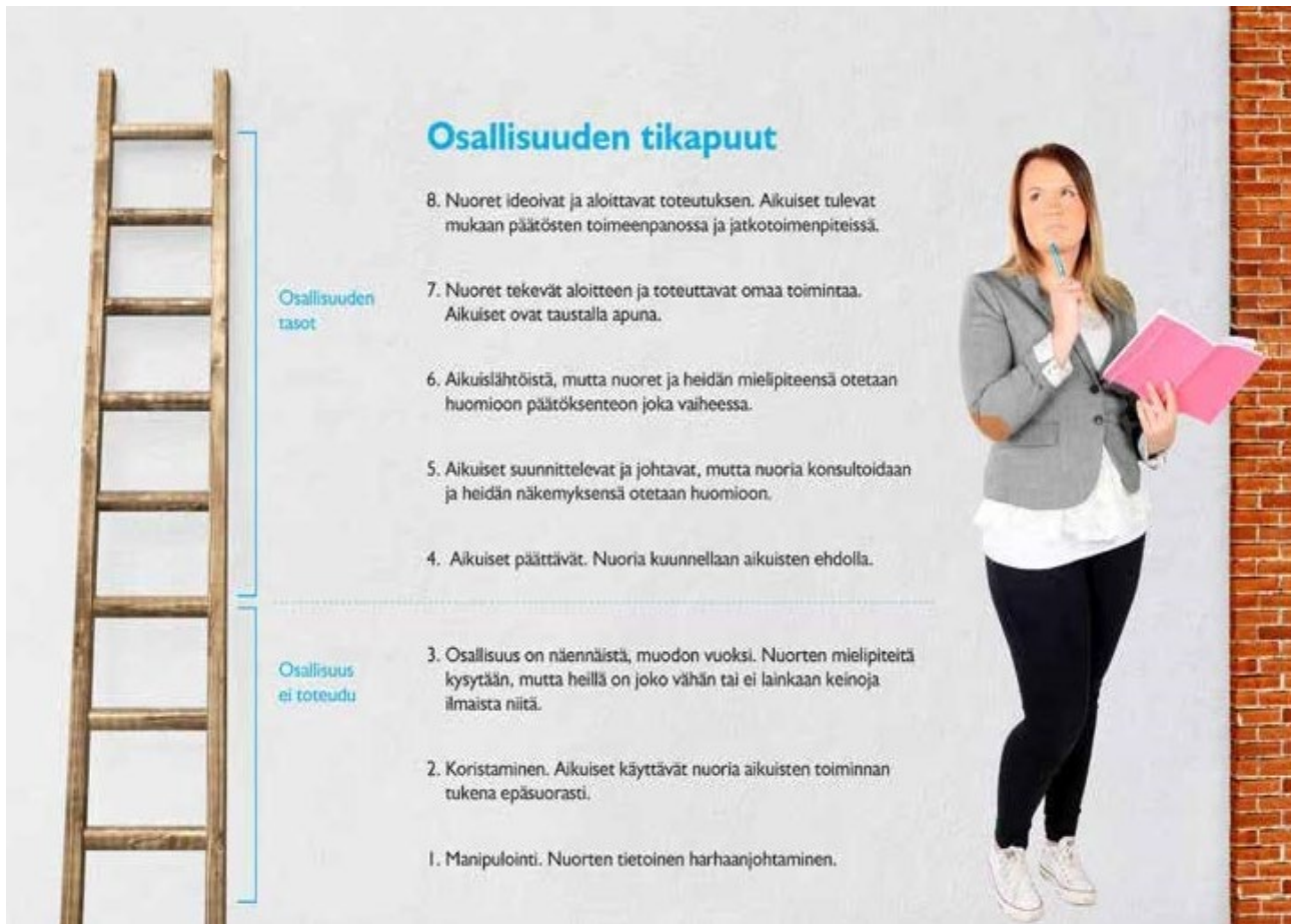
Kuvio 2. Osallisuuden tikapuut