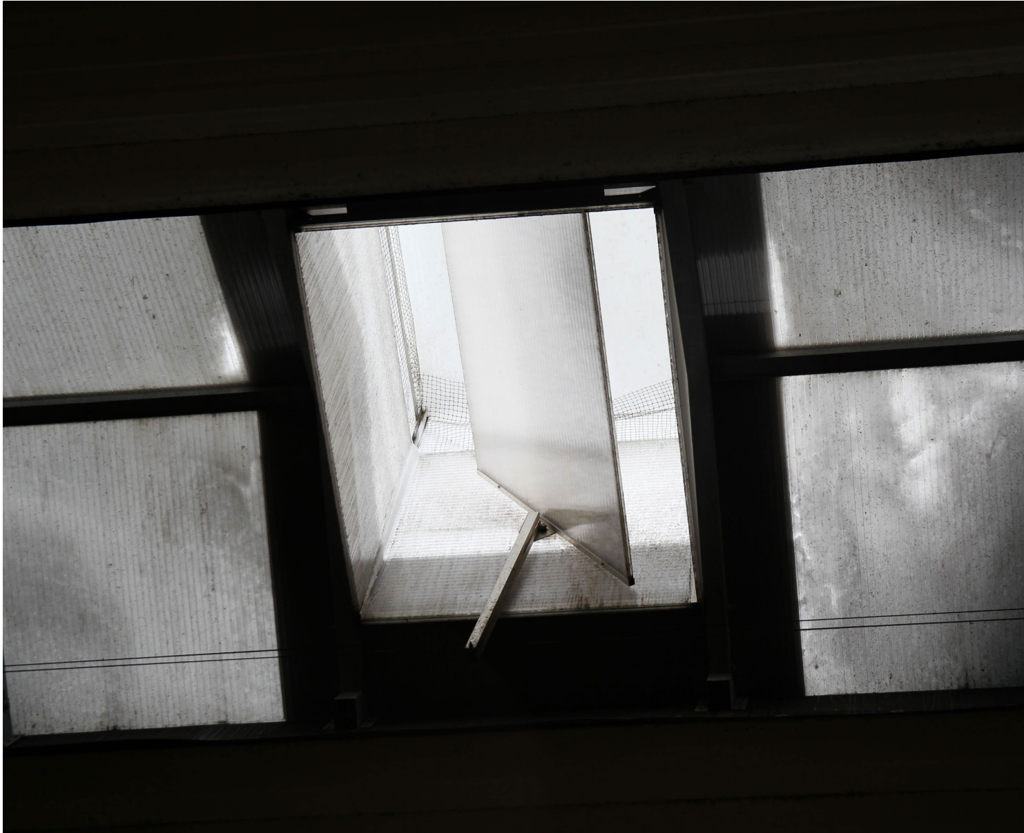
Myös poistoilmahormit on verkotettu.