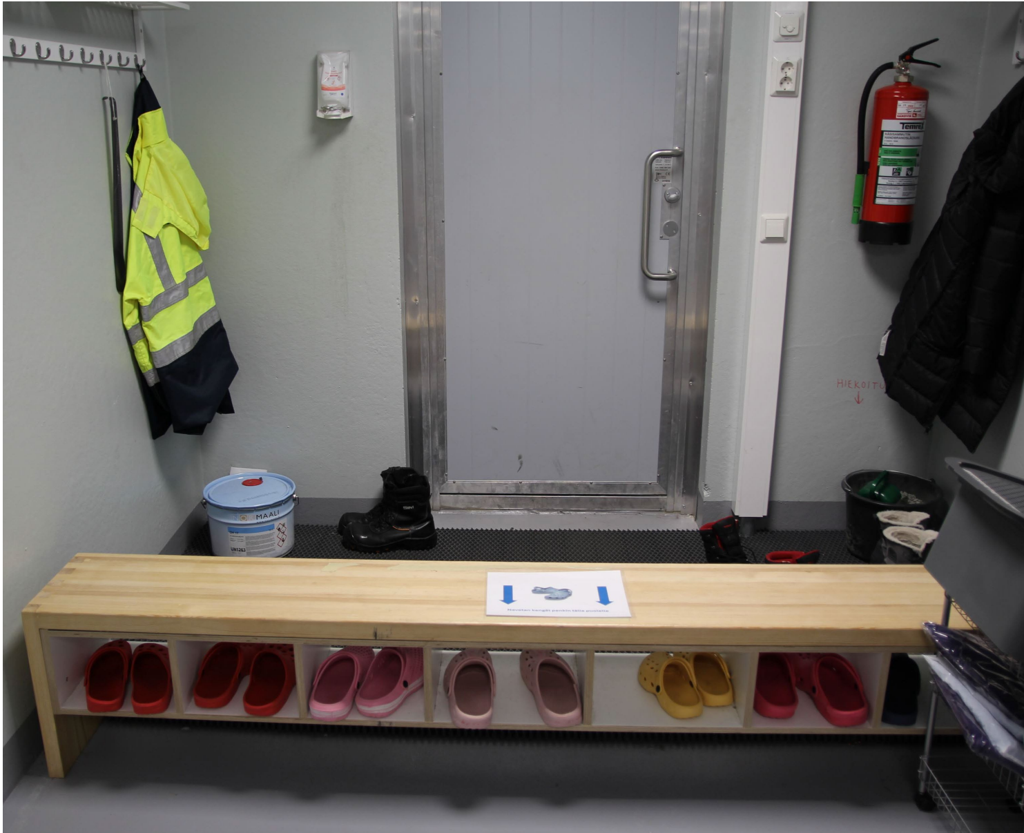
Navetan työntekijät ja työvuorossa olevat opiskelijat tulevat navettaan tautisulun kautta