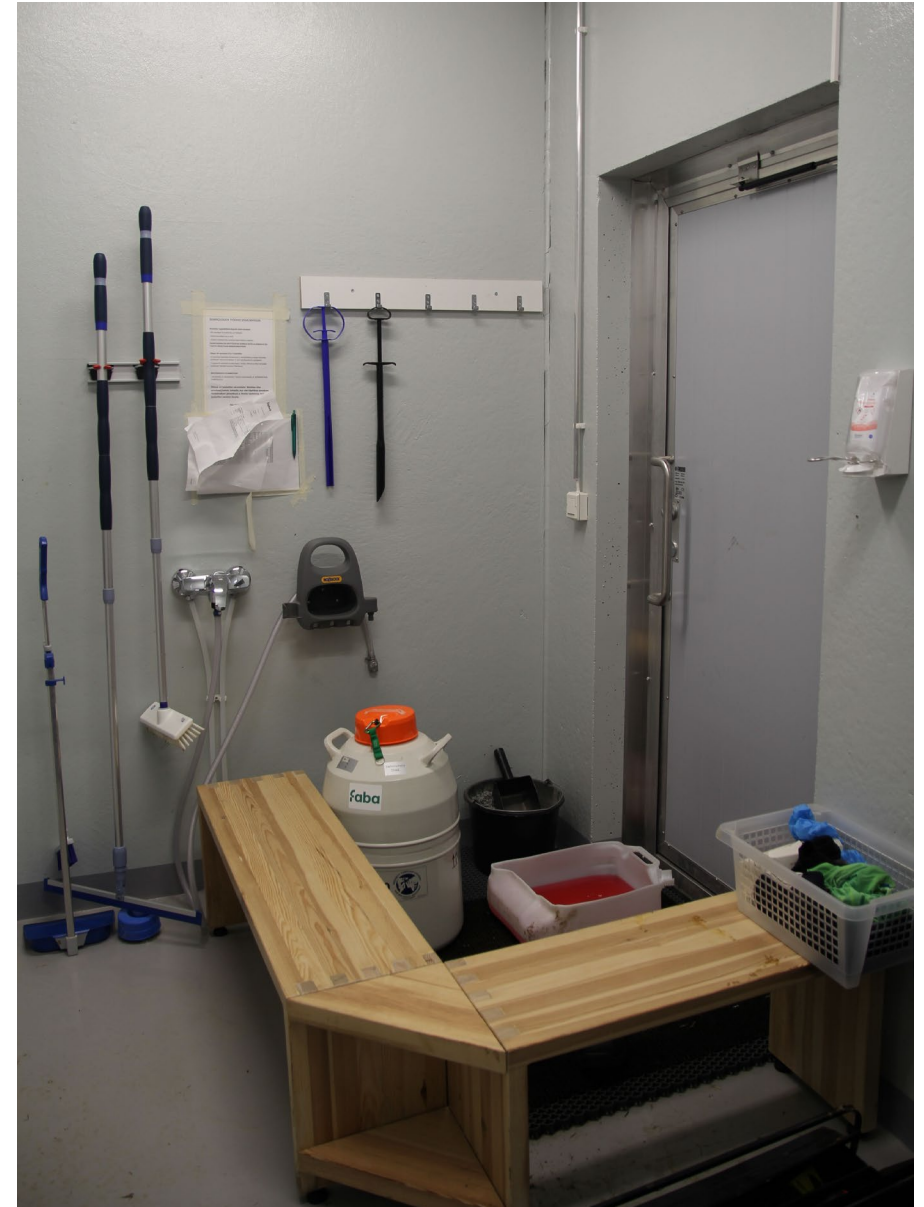
Eläinlääkäreille, seminologeille ym. on oma sisäänkäynti tautisululla.